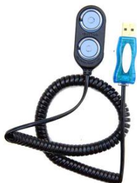
Lecteur USB pour PC