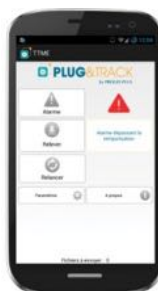
Smartphone & Tablette Android