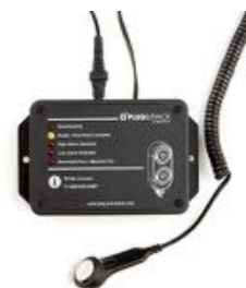
TB Net Connect sur Ethernet